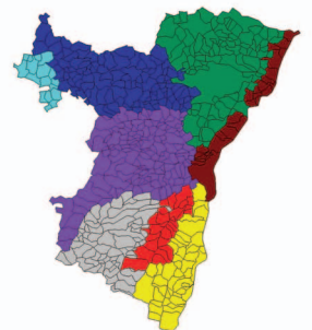
Découpage du département en unités de gestion

Pour une meilleure gestion du territoire, le département est découpé en lots de chasse. Ces unités de gestion cynégétique permettent une analyse plus fine. Les études à la commune sont donc réalisées par regroupement de lots.