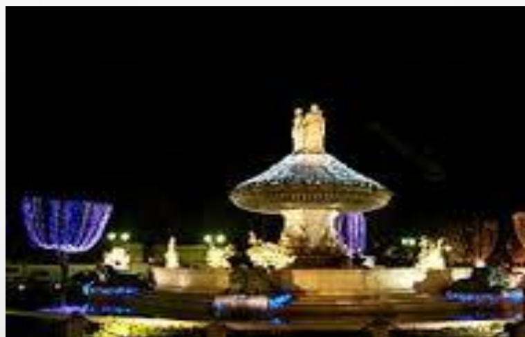
Aix en Provence